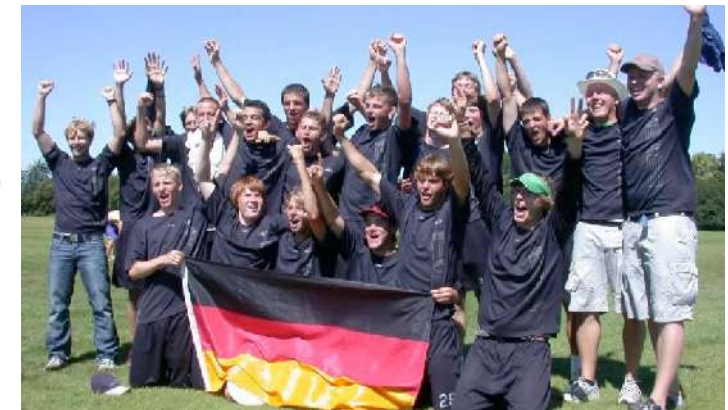
Die „GoldJungs“: U20- Europameister 2007

| Basisinformationen für Übungsleiter, für die Ausbildung von Trainern und für Fortbildungen im Hochschulsport hinsichtlich der Grundausbildung von Jugendlichen im Teamsport Ultimate Frisbee bereit zu halten.