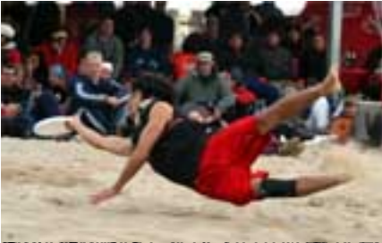
Ultimate - Mannschaftssport ohne Schiedsrichter (2009, PDF)