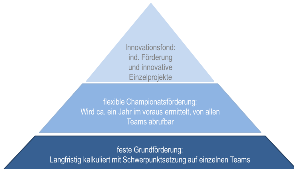
Abbildung 2: Grundstruktur der Förderung

Die Grundstruktur des Förderkonzepts sieht, wie in Abbildung 2 dargestellt, eine Dreiteilung der Förderung vor. Eine Grundförderung, die jedem Team für einen 4-Jahres-Zyklus zur Verfügung gestellt wird, dient einer langfristigen Planung für Trainingsmaßnahmen und Vorbereitungswettkämpfe, sowie Aufwandsentschädigungen für Trainer. Darüber hinaus wird ein zweiter Fördertopf jährlich für die anstehenden Championate eingesetzt. In einem dritten Bereich gibt es die Möglichkeit, Förderung sowohl für innovative Förderprojekte als auch für individuelle Förderung einzelner Spielerinnen und Spieler zu beantragen.